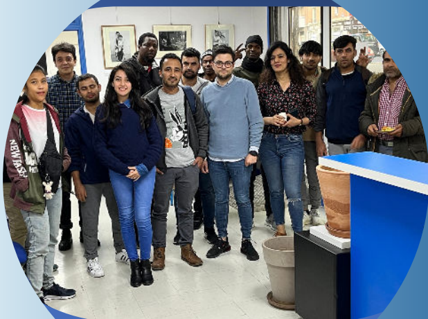
Semaine de l'Intégration octobre 2022

Itinéraire d'une stagiaire de FIDE interview France 24 août 2022